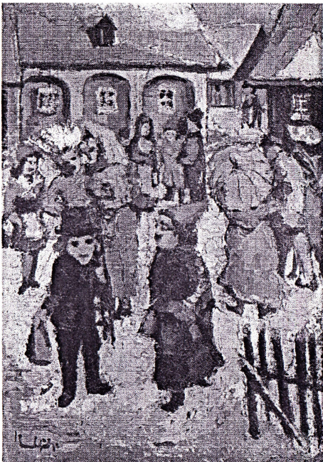
Kinderfastnacht Öl, 1955