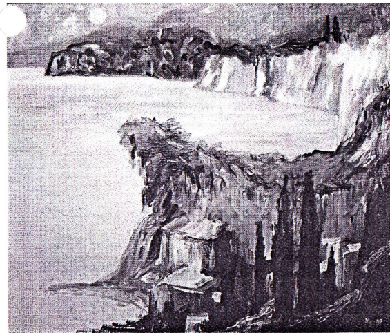
Bucht von Sorrento, Öl, 2007