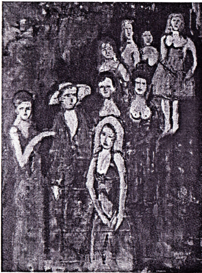
Frauen II Ol, 2007